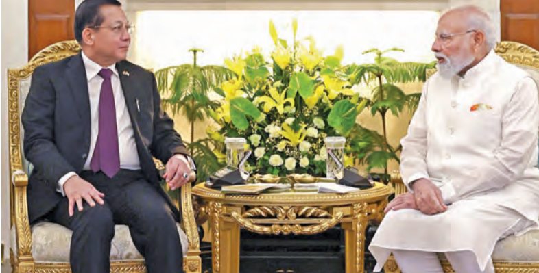
మయన్మార్ లో శాంతి చర్చలకు భారత్ సంపూర్ణ మద్దతు