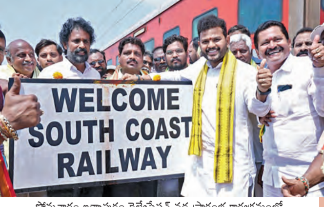
సోమవారం ఇచ్చాపురం రైల్వే స్టేషన్ వద్ద ప్రారంభ కార్యక్రమంలో

ఇచ్చాపురం (శ్రీకాకుళం జిల్లా), జాన్ 1 ప్రభాతవార్త: విశాఖపట్నం కేంద్రంగా దక్షిణ కోస్తా రైల్వే జోన్ ఏర్పాటుతో ఉత్తరాంధ్ర ప్రజల చిరకాల ఆకాంక్ష నెరవేరిందని కేంద్ర పౌర విమానయాన శాఖ మంత్రి కింజరాపు రామోహన్ నాయుడు స్పష్టం చేశారు. సోమవారం ఇచ్చాపురం రైల్వే స్టేషన్లో అత్యంత వైభవంగా నిర్వహించిన రైల్వే జోన్ ప్రారంభోత్సవ అధికారిక కార్యక్రమంలో కేంద్ర మంత్రి ముఖ్య అతిథిగా పాల్గొని ప్రసంగించారు. ఈ సందర్భంగా రామోహన్ నాయుడు అత్యంత భావోద్వేగంతో మాట్లాడుతూ విశాఖ రైల్వే జోన్ సాధన కోసం గత 12 సంవత్సరాలుగా తాను సాగించిన సుదీర్ఘ పోరాటాన్ని గుర్తు చేసుకున్నారు. గతంలో పార్లమెంట్లో ఈ అంశంపై అనేకసార్లు గళమెత్తినా, ఇదే ఇచ్చాపురం రైల్వే స్టేషన్లో ప్రజాప్రతినిధిగా డిక్షలు కూడా చేపట్టినా పేర్కొన్నారు. అనాడు ఒక సామాన్య ప్రజాప్రతినిధిగా ప్రజల వక్షాన నిలబడి పోరాడారు. ఈరోజు కేంద్ర మంత్రిగా బాధ్యతలు నిర్వహిస్తున్న తరుణంలోనే ఆ కల సాకారం కావడం, నా చేతుల మీదుగానే ఈ జోన్ ప్రారంభం కావడం నా జీవితంలో ఎప్పటికీ మరువలేని మహత్ర ఘట్టం అని హర్షం వ్యక్తం చేశారు. సోమవారం సుదీర్ఘ విశాఖపట్నం కేంద్రంగా దక్షిణ కోస్తా రైల్వే జోన్ అధికారిక పరిపాలన ప్రారంభమైందని కేంద్ర మంత్రి వెల్లడించారు. సూతన జోన్ ఏర్పాటుతో ఈ ప్రాంత రైల్వే సమస్యలకు స్థానికంగానే త్వరితగతిన పరిష్కారాలు లభిస్తాయని, పరిపాలన మరింత సుభద్రతరం అవుతుందని చెప్పారు. గతంలో స్వర్ణీయ కింజరాపు ఎర్రనాయుడు కూడా ఉత్తరాంధ్రకు రైల్వే జోన్ సాధించడం లక్ష్యంగా వివేక కృషి చేశారని, వారి