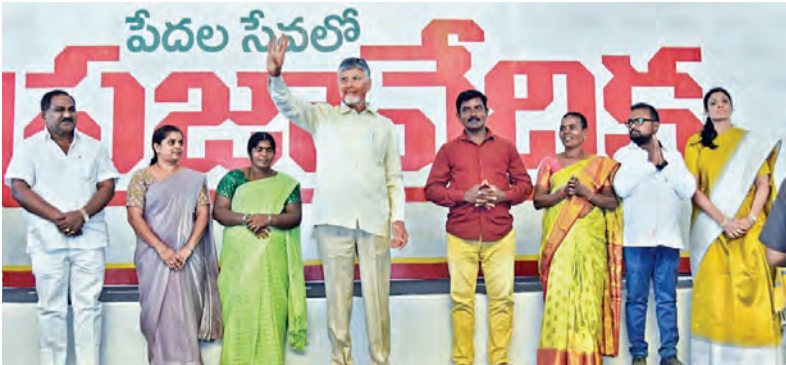
సోమవారం చామరం గ్రామ ప్రజావేదిక సభలో ప్రజలకు అభివృద్ధి చేస్తున్న సిఎం చంద్రబాబు